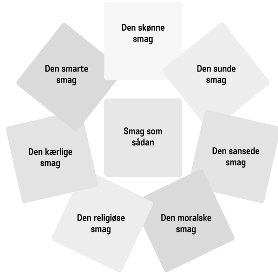
Figur 2.1. Smagssystematik.