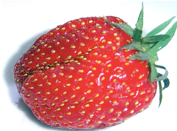
Modent havejordbær.

I Europa har vi en række vilde jordbærarter. Men havejordbær er faktisk en krydsning mellem to forskellige vilde amerikanske jordbærarter, og krydsningen blev udført i Europa for under 300 år siden som et vellykket forsøg på at sammenbringe egenskaberne af en stor og livskraftig amerikansk jordbærart med egenskaberne af en aromatisk, men lille og ubetydelig europæisk jordbærart. En senere hybrid af denne krydsning fik navnet Fragaria × ananassa for at afspejle, at bærret har en aroma, der minder om ananas.