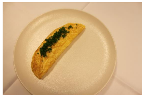
Figur 1 På billedet ses en foldet omelet

Inden kokken laver sin omelet, beslutter han hvilken form den skal have. Skal den være flad eller foldet? Skal fyldet være indeni eller udenpå? Den typiske form på omeletter her hjemme er cigarformede - når kokken har fået fyldet i æggemassen og tilberedningen nærmer sig afrundingen, skal omeletten formes så den tager form som en cigar – tyk i midten og tynd i enderne.