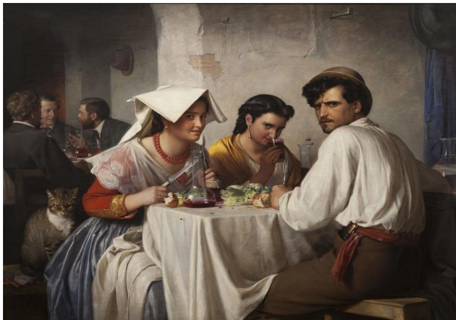
Carl Bloch "Fra et romersk osteria" 1866 (SMK)

Inden besøget på den lokale restaurant, skal I beslutte jer for, hvordan I skaber jeres måltids-parafraze med udgangspunkt i Carl Blochs maleri " Fra et romersk osteria ".