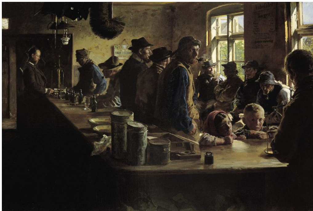
P.S. Krøyer "I købmandens bod, når der ikke fiskes. Skagen". 1882 (Den Hirschprungske Samling)