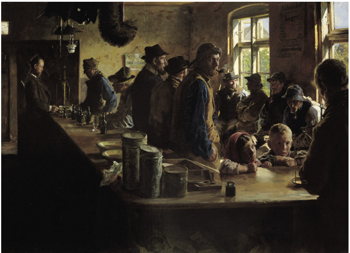
P.S. Krøyer " I købmandens bod, når der ikke fiskes. Skagen ". 1882 ( Den Hirschprungske Samling