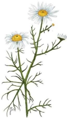
Vellugtende kamille ( Matricaria recutita )

Skallen er hvid eller let brunlig, og hjerteformet.