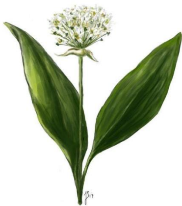
Ramsløg ( Allium ursinum )