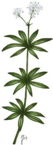
Skovmærke ( Galium odoratum )

Bladene er savtakkede og tæt dækkede af små brændehår. Blomsterne er uanseelige og grønne. De vokser i lange klaser.