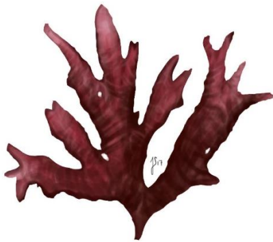
Søl ( Palmaria palmata )

Sensorik: Smager af salt og umami med duft af hav, lakrids og viol. Konsistensen er fast med en blank overflade.