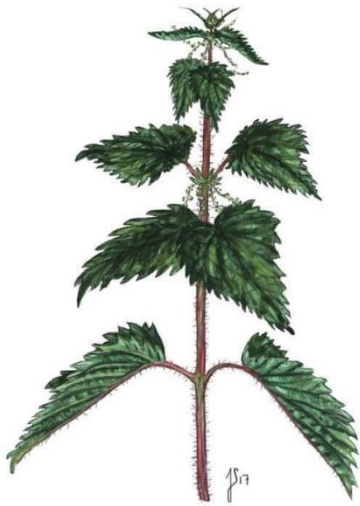
Brændenælde ( Urtica dioica )