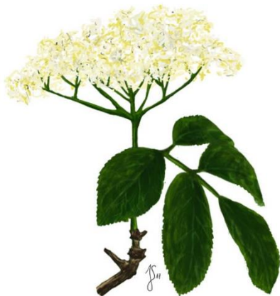
Hyldeblomst ( Sambucus nigra )

Bladene er smalle, spidse og lancetformede. De sidder i karakteristiske kranser op langs stilken. En krans af otte blade er meget karakteristisk. Blomsterne er små og hvide.