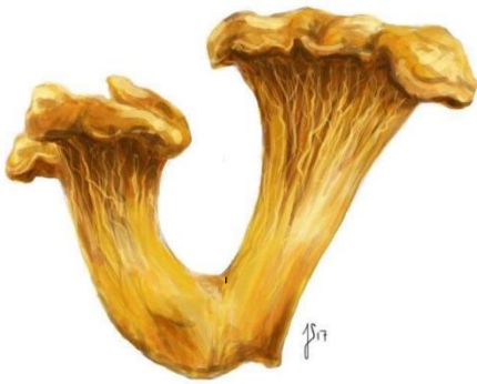
Almindelig kantarel ( Cantharellus cibarius )

Sensorik: Smager en smule bitter og af umami. Lugter behagligt af abrikoser og skov. Kødagtig og fast konsistens.