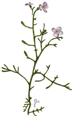
Strandsennep ( Cakile maritima )

Beskrivelse: Busk med rynkede, mørkegrønne blade og korte, brune torne. Blomstrer med gullige, pink eller rosa blade.