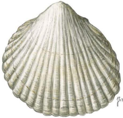
Almindelig hjertemusling ( Cerastoderma edule )