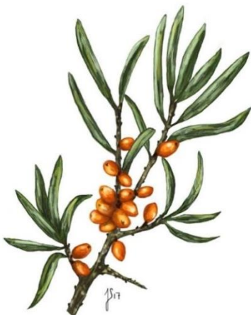
Havtorn ( Hippophaë rhamnoides )

Beskrivelse: De hårde, brune nødder sidder i klaser på busken eller træet. De knækkede nødder er runde og råhvide.