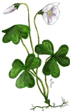
Skovsyre ( Oxalis acetosella )

Bladene er ellipseformede og grønne. Blomsterne er hvide og stjernelignede, og de sidder i små skærme.