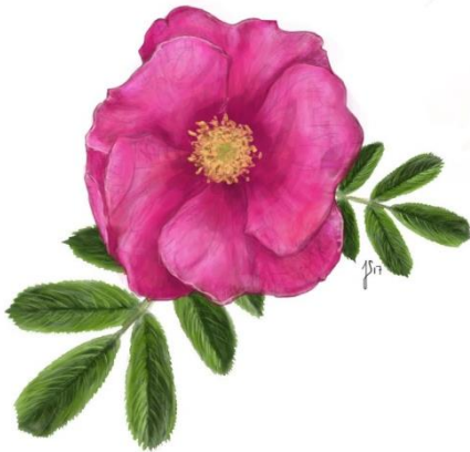
Hybenrose ( Rosa rugosa )

Beskrivelse: Kileformet blad, hvorfra der udgår en række nye blade. Unge blade er gennemsigtige og røde, de ældre er tykkere og mørkerøde.