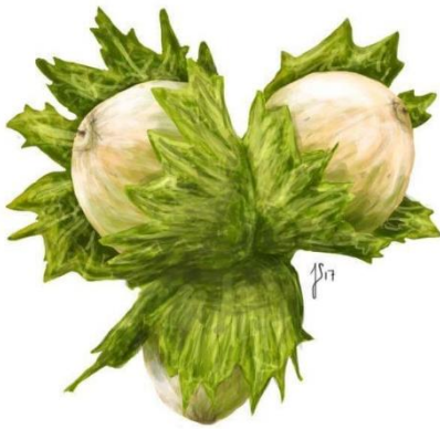
Hassel ( Corylus avellana )

Beskrivelse: Lille og nydelig med en glat, mørk og orangegul hat, der er lidt hvælvet og nedtrykt i midten. Undersiden har den fastsiddende og forgrenede lameller.