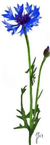
Kornblomst ( Centaurea cyanus )

Blomsterne har et klart, gult, kuppel-lignende hoved med hvide, aflange blade hele vejen rundt.