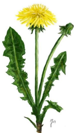
Mælkebøtte ( Taraxacum officinale )

Lille, grøn kløverplante med en trådtynd, lysegrøn stængel med tre hjerteformede blade. Blomsten har fem hvide blade med rosa, violette striber og i midten er blomsten gul. Stilken er tynd og lyserød.